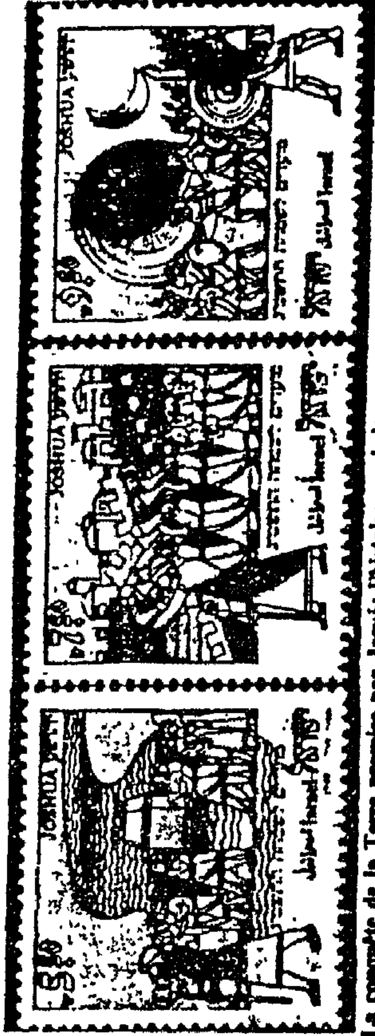
La conquête de la Terre promise par Josué: l'histoire se répète.

Un second timbre, de 7.50 chekels, gris-violet-rose-turquoise-noir, nous montre Josué dirigeant les opérations pour la prise de Jéricho, tandis que les sacrificateurs sonnent la trompette